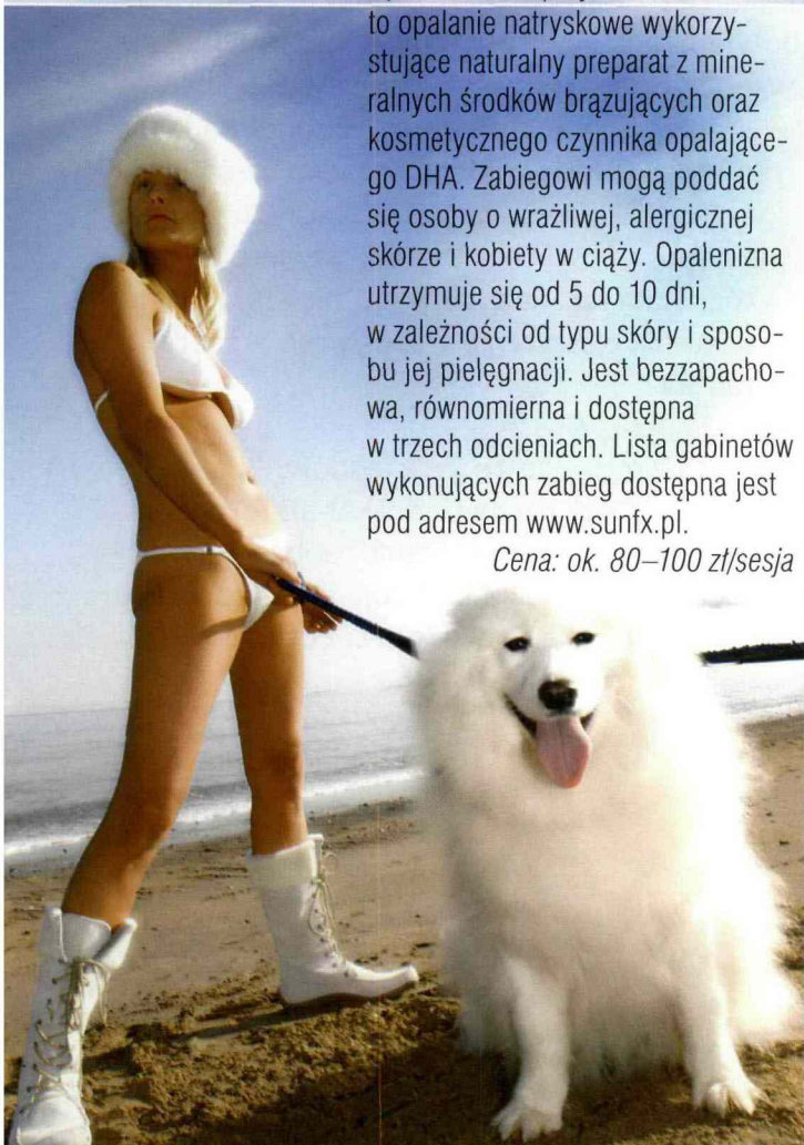
Cena: ok. 80-100 zł/sesja

Opalenizna w sprayu SunFX Polska to opalenie natryskowe wykorzystujące naturalny preparat z mineralnych środków brązujących oraz kosmetycznego czynnika opalającego DHA. Zabiegowi mogą poddać się osoby o wrażliwej, alergicznej skórze i kobiety w ciąży. Opalenizna utrzymuje się od 5 do 10 dni, w zależności od typu skóry i sposobu jej pielęgnacji. Jest bezzapachowa, równomierna i dostępna w trzech odcieniach. Lista gabinetów wykonujących zabieg dostępna jest pod adresem www.sunfx.pl .