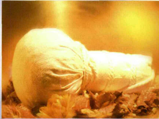
Cena: 390 zł/2 godz.

Laboratorium Isabelle Lancray Paris wprowadza nowy zabieg Sanshui bazujący na tradycyjnej chińskiej medycynie. Składa się na niego m. in. masaż gorącymi stemplami, który wykorzystuje mieszaninę ziół, przypraw, kwiatów, owoców i olejków eterycznych. Podczas terapii pobudzone zostają punkty energetyczne, a mózg produkuje więcej endorfin. Lista gabinetów wykonujących zabieg dostępna jest pod adresem www.bionantech.com.pl , dział Ośrodków i Gabinetów.